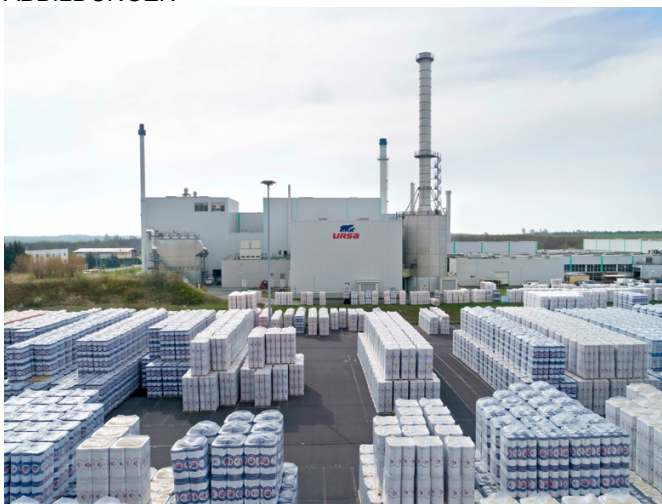
Die Übernahme von URSA markiert einen wichtigen Meilenstein für Etex.