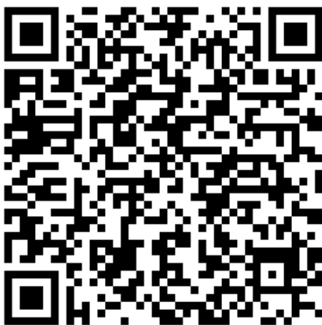
Link zur neuen Cedral Internetplattform für Bauherren.

Text und Bilder stehen zum Download hier zur Verfügung. Abdruck honorarfrei. Belegexemplar erbeten.