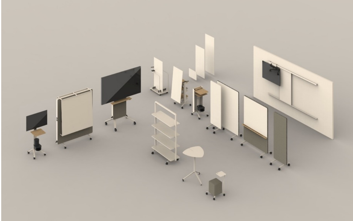
Vue d'ensemble de la gamme Confair Next (design : Wilkhahn) : la « boîte à outils » modulable et coordonnée dans les moindres détails pour favoriser la collaboration créative. Illustration : Wilkhahn

Bad Münders, août 2024. La présentation de la gamme Confair Next est le point phare de la présence de Wilkhahn au salon. Avec ses modules d'espace qui se caractérisent par une utilisation flexible et autonome, cette « boîte à outils » haut de gamme et parfaitement coordonnée vient compléter les solutions d'aménagement existantes pour les espaces de communication et de collaboration.